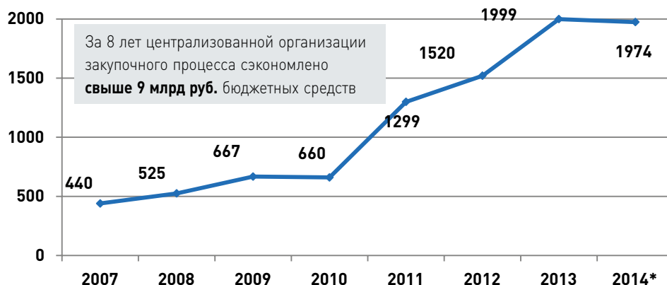
Рисунок 1. Динамика эффективности осуществления закупок уполномоченным органом (2007–2013 гг.) и уполномоченным учреждением (2014 г.), %

*по результатам конкурентных процедур, признанных состоявшимися