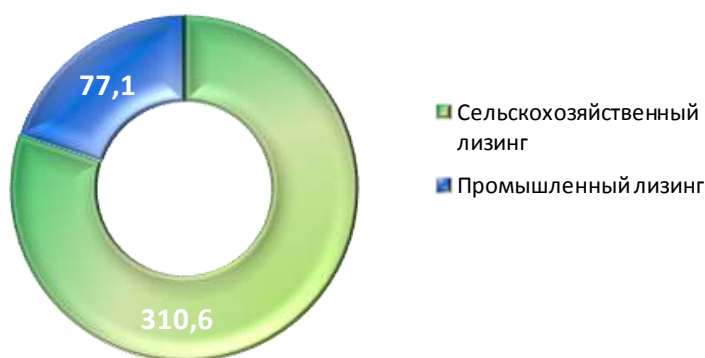
Структура техники, приобретенной фондом в 2018 году, по направлению лизинговой деятельности, млн. рублей

Согласно указанным направлениям за 2018 год через АКЛФ приобретено 86 единиц техники и оборудования на сумму 387,7 млн. рублей (использовано средств фонда – 307,8 млн. рублей).