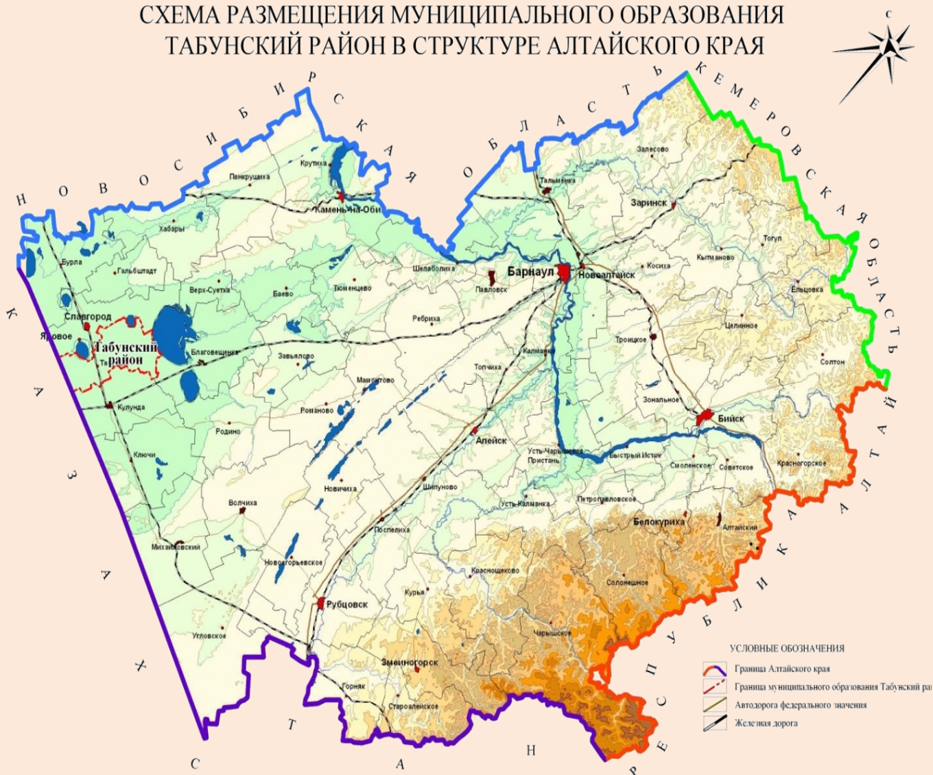
Рис. 2 – Местоположение Табунский район в Алтайском крае

Табунский район расположен в западной части Алтайского края (Рис.1). На севере район граничит со Славгородским районом (районный центр – г. Славгород), на востоке – с Благовещенским районом (районный центр – с. Благовещенка), на юге – с Кулундинским районом (районный центр – с. Кулунда), на западе – с Республикой Казахстан (Рис.2).