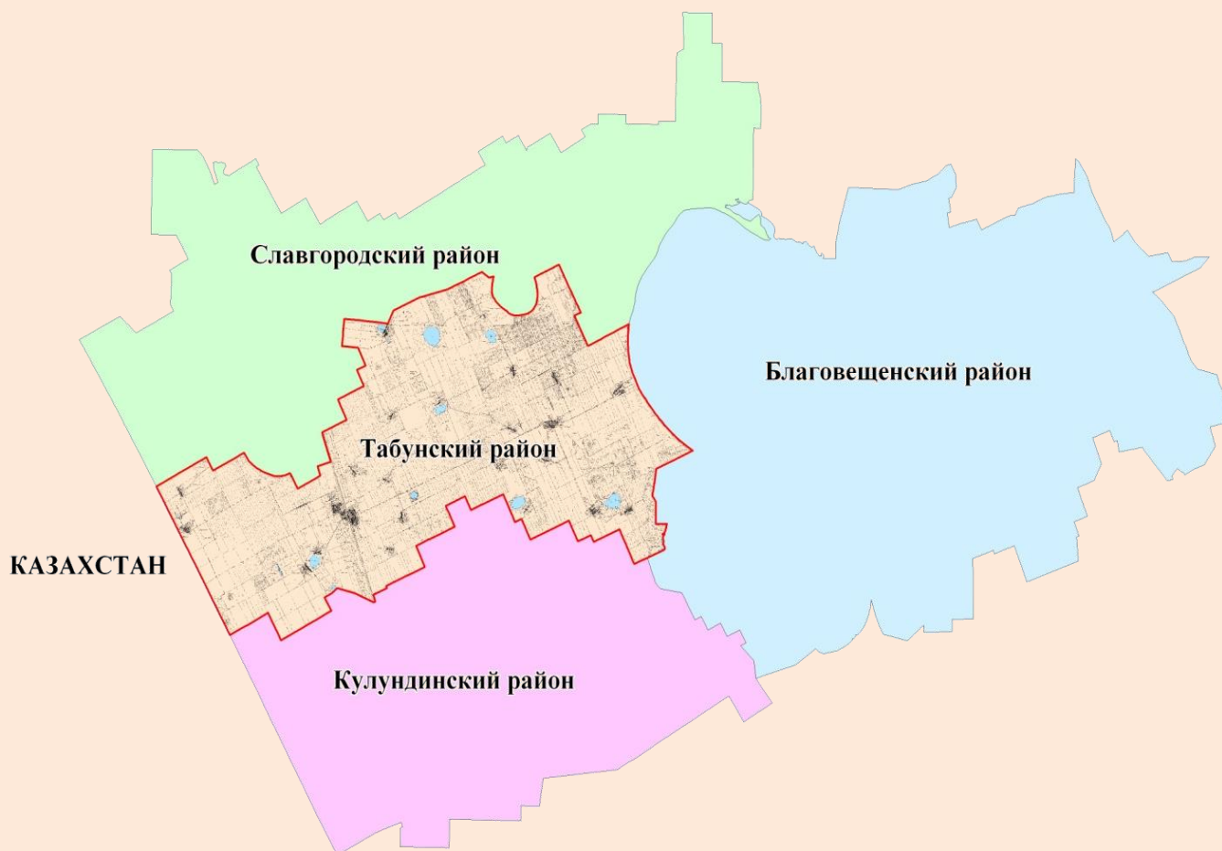
Рис.3 – Границы Табунского района

Население района составляет 9067 человек. В района 24 сельских населенных пунктов, наиболее крупные из них – с. Табуны, с. Алтайское, с. Сереброполь, с. Большеромановка.