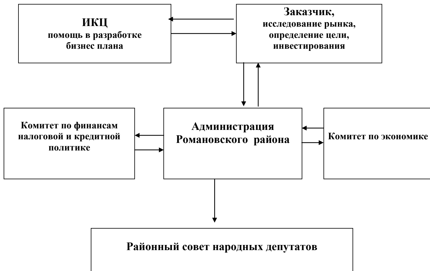
Схема реализации инвестиционного проекта